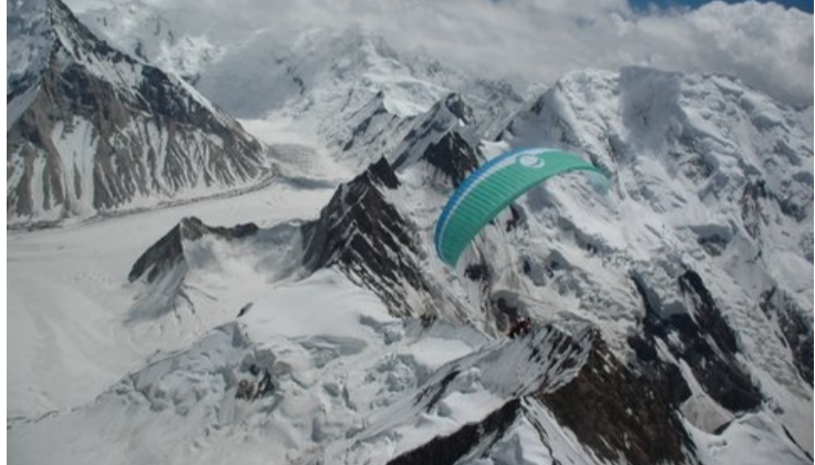
Sobrevolando el Karakorum.